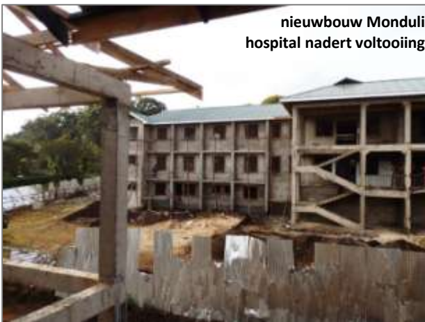
nieuwbouw Monduli hospital nadert voltooiing