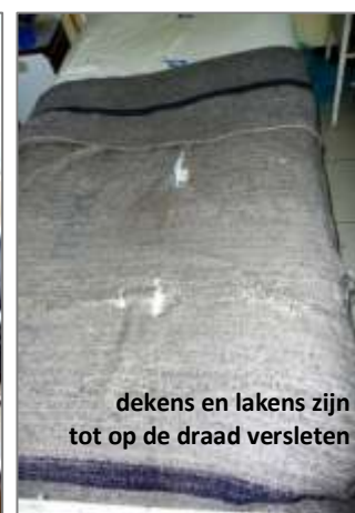
dekens en lakens zijn tot op de draad versleten