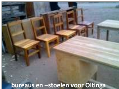
bureaus en –stoelen voor Oltinga