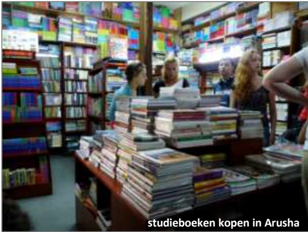
studieboeken kopen in Arusha