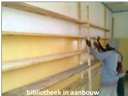
bibliotheek in aanbouw