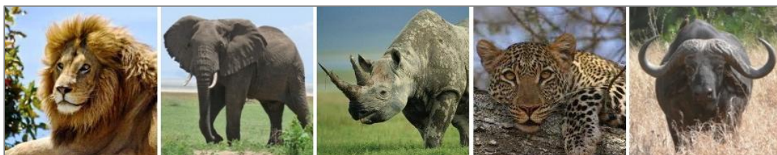
Big Five van Tanzania: leeuw, olifant, neushoorn, luipaard en buffel.