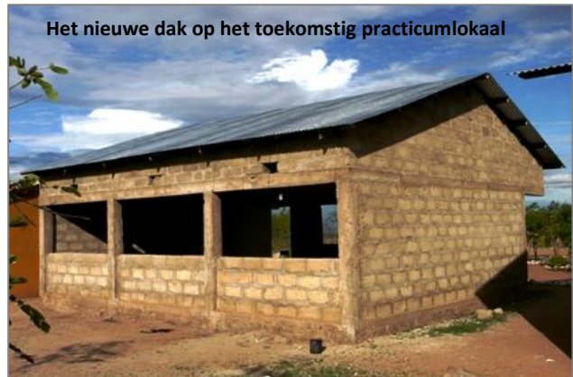
Het nieuwe dak op het toekomstig practicumlokaal

Zoals u wellicht weet, is er op Oltinga geen vorm van ontspanning, buitenom een eerder gedoneerde partij ballen. Met tafeltennis komen ook meisjes 'aan de bal'. • Vorig jaar ontving Tanzania Support een gift van Dame Alice Owen's school uit Londen ten behoeve van een practicumlokaal voor schei-/natuurkunde en biologie op Oltinga.