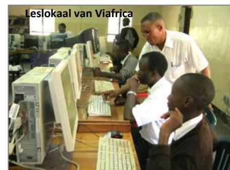
Leslokaal van Viafrica

succesvolle implementatie van computers geholpen. Hun zgn. Classworks programma voorziet gedurende 3 jaar in de opleiding van 2 vakdocenten computerkunde, training van de overige docenten en installatie, beheer en onderhoud van het computernetwerk. Zie voor meer informatie www.viafrica.org