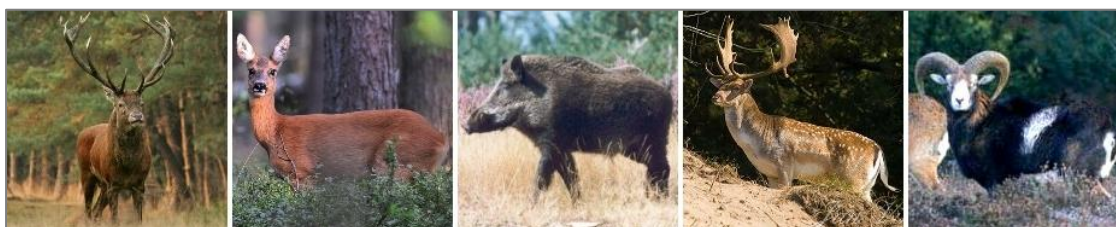
Big Five van de Veluwe: edelhert, ree, wild zwijn, damhert en moeflon.