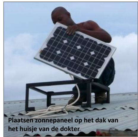
Plaatsen zonnepaneel op het dak van het huisje van de dokter

Wilt u ook meedoen aan onze Wilde Ganzen actie? Stort dan een gift op rekeningnummer 40.000 van Wilde Ganzen te Hilversum, o.v.v. project 2011.0188 van Stichting Tanzania Support. Wilde Ganzen (heeft de ANBI-status) voegt 55% aan uw gift toe!