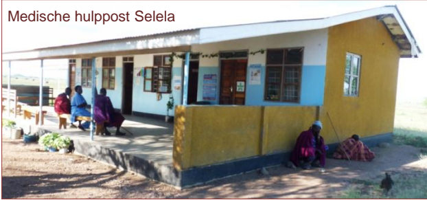
Medische hulppost Selela

De Stichting Tanzania Support heeft een microscoop en noodverlichting kunnen verstrekken. Verder willen we structurele stroomvoorziening via zonne-energie (in Selela is geen elektriciteitsnet) realiseren en een contactmogelijkheid met het 30 kilometer verderop gelegen ziekenhuisje via een High Frequency Radio (er is ook geen mobiel bereik).